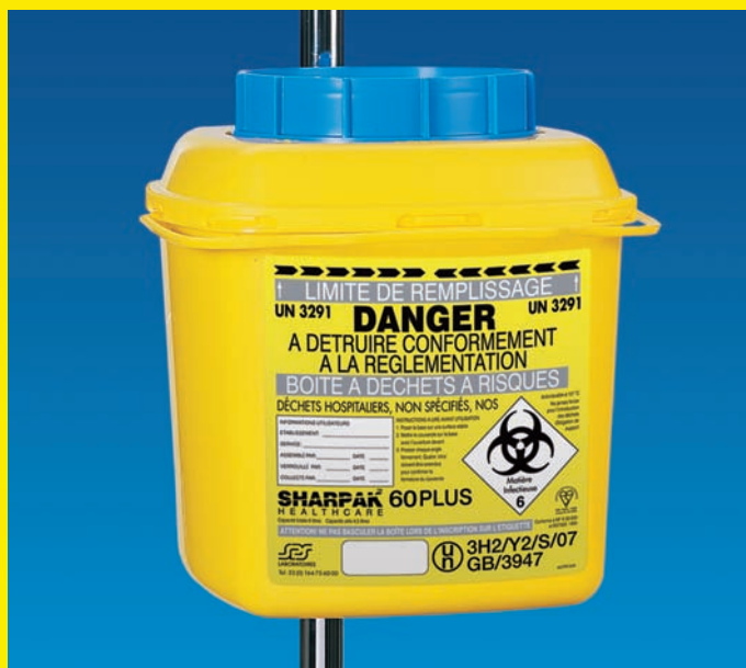
MONTAGE SUR CHARIOT / SUPPORT D'ACCESSOIRES

Le kit d'accessoires de montage universel contient tous les composants nécessaires pour le montage en toute sécurité des boîtes SHARPAK® 60, 120 et 220 PLUS au mur, sur un chariot ou sur un support d'accessoires.